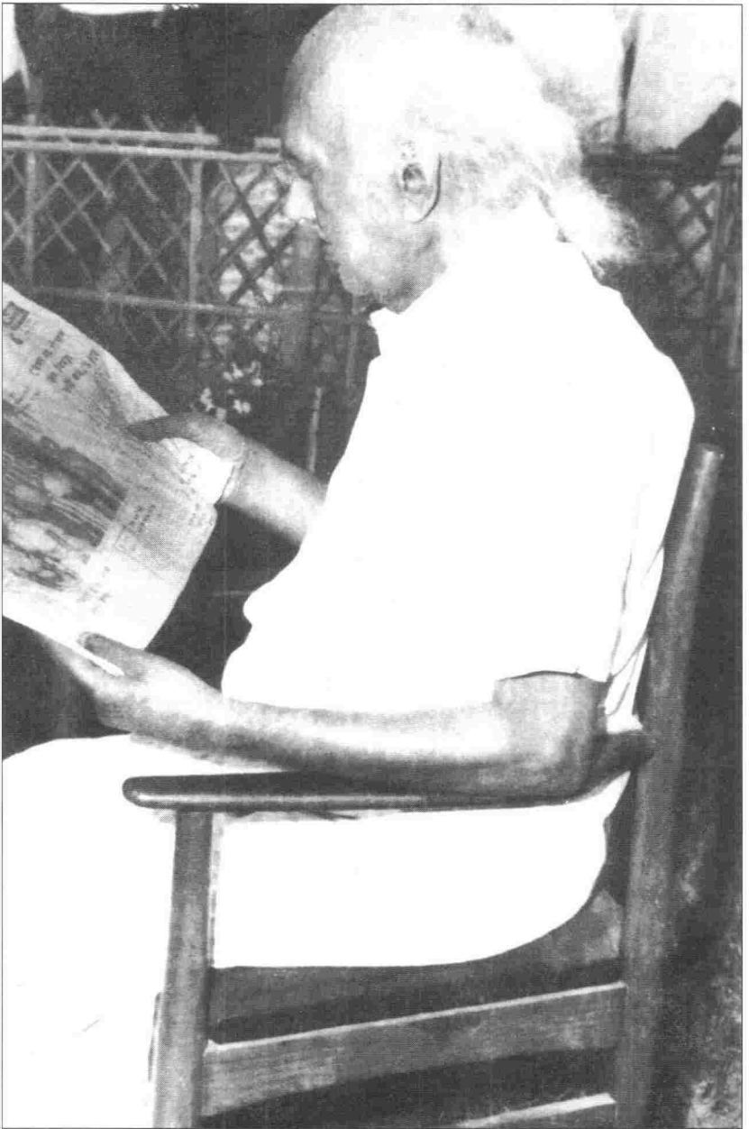
ধানমন্ডির কবিভবনের আঙিনায় চেয়ারে বসে নজরুল